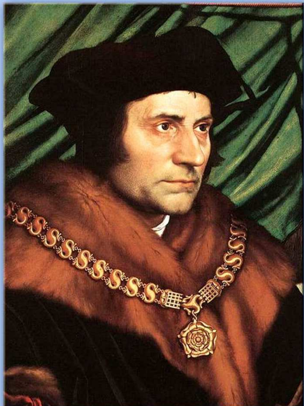
SAN TOMMASO MORO Londra, 7 febbraio 1478 – Londra 6 luglio 1535

2. Tommaso Moro visse una straordinaria carriera politica nel suo Paese. Nato a Londra nel 1478 da rispettabile famiglia, fu posto, sin da giovane al servizio dell'Arcivescovo di Canterbury Giovanni Morton, Cancelliere del Regno. Proseguì poi gli studi in legge ad Oxford e a Londra, allargando i suoi interessi ad ampi settori della cultura, della teologia e della letteratura classica. (...)