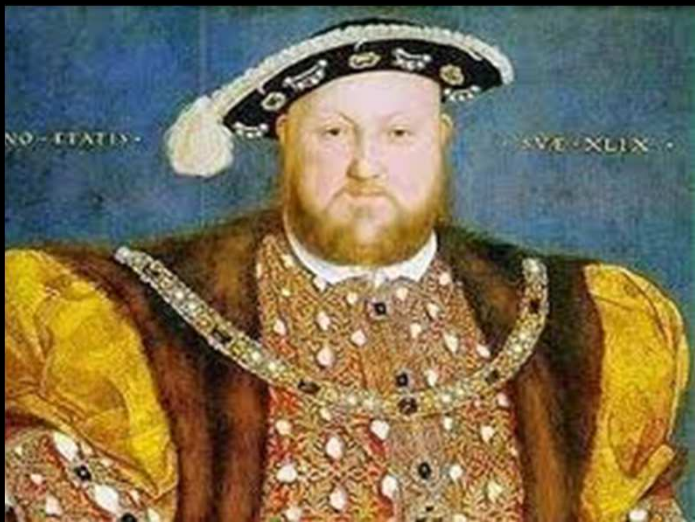
ENRICO VIII Tudor Greenwich, 28 giugno 1491 – Londra 28 gennaio 1547